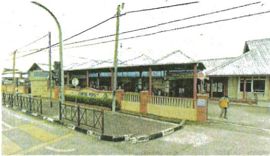
HOSPITAL Pontian antara 26 fasiliti kesihatan yang akan dinaik taraf seperti mana diumumkan dalam Belanjawan 2023.

PONTIAN – Pengumuman menaikkan taraf Hospital Pontian disifatkan tepat dan telah lama dinanti-nantikan bagi mengubah 'wajah' hospital yang telah berusia 96 tahun itu.