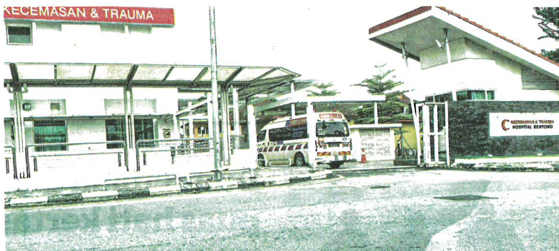
PESAKIT mengadu mereka perlu menunggu lama sehingga 10 jam untuk mendapatkan rawatan di Unit Kecemasan Hospital Bentong.

"Saya tidak tahu lagi hendak buat apa, hanya mampu memandang anak dalam keadaan sedih dan pilu, saya bukanlah sesiapa dan kerja biasa sahaja, jadi saya bawa anak saya balik terus ke farmasi membeli ubat, de-