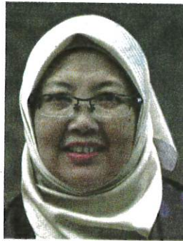
Dr Zaliha Mustafa

The Sekijang member of parliament also announced an allocation of RM600,000 for the construction of a 422-vehicle capacity parking lot at Segamat Hospital, which is expected to ease congestion when the new building starts operating.